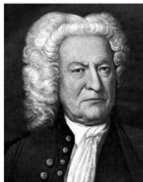
Johann Sebastian Bach (1685-1750)