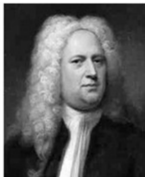
Georg Friedrich Händel (1685-1759)

Veranstalter: Magistrat der Stadt Kelsterbach und St. Martinsgemeinde